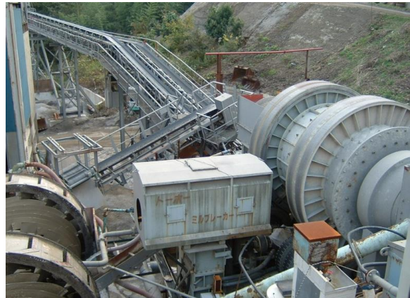
再生骨材の製造設備

BFCCU 研究会参加各社はサプライチェーン全体の CO 2 排出量削減ならびに資源の有効活用に取り組んでいます。今後は、環境配慮性の高いコンクリートである CELBIC-RA の実現場での普及・展開を図り、サーキュラーエコノミーの実現ならびに 2050 年カーボンニュートラルの実現に貢献してまいります。