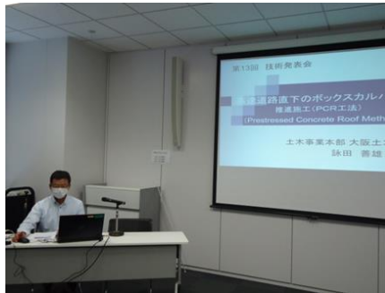
優秀賞 2 の発表