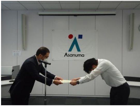
社長賞 1 表彰状授与