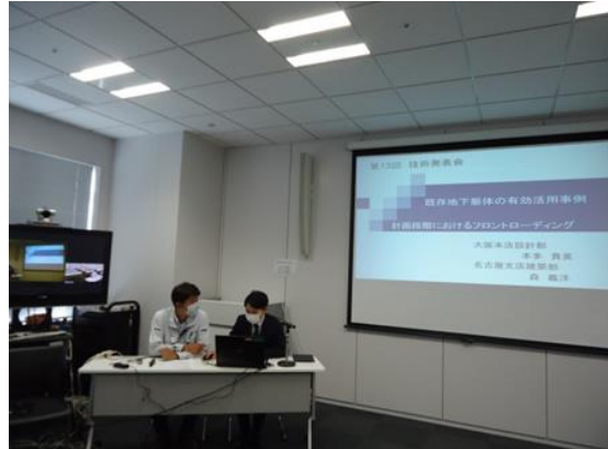
社長賞 2 の発表