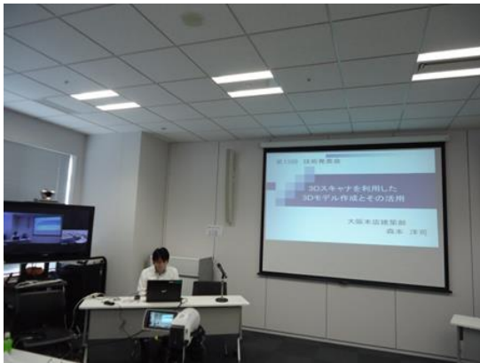
社長賞 1 の発表