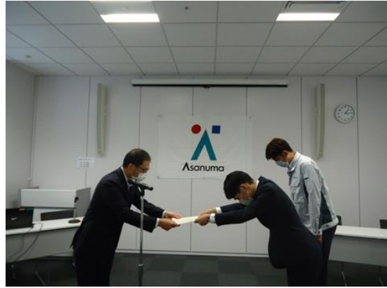
社長賞 2 表彰状授与