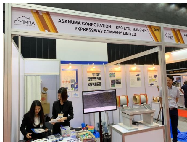
展示ブースの様子