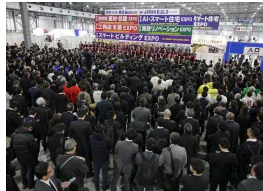
【展示会 (オープニングセレモニー)】