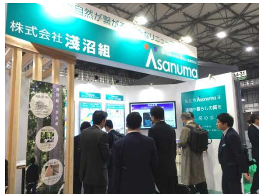
【展示ブース(展示内容説明)】