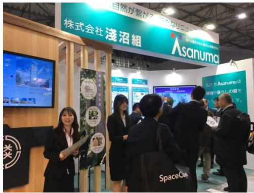
【展示ブース(展示内容説明)】