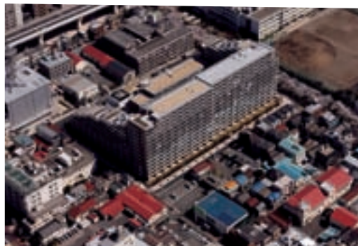
(仮称)大島3丁目プロジェクト