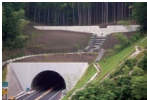
舞鶴若狭自動車道 小浜東工事