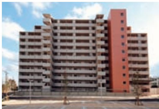
公務員宿舎大野城住宅(仮称)整備事業(PFI)